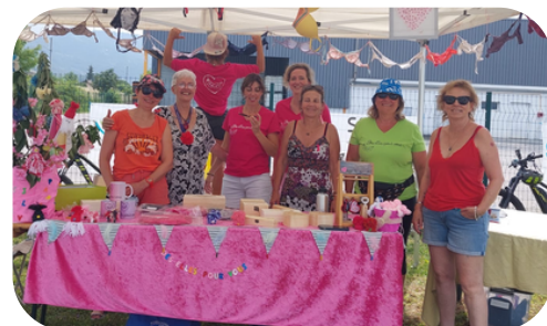
Stand de Thiez en juillet 2023