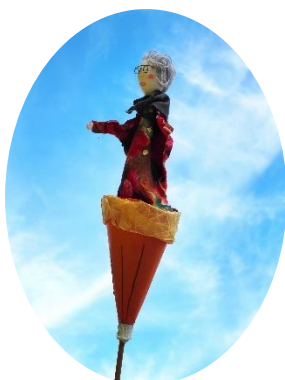
La marotte du groupe: Mamie Mistouflette!